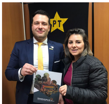
Dep. Leonel Radde (PT)

Neste mês ainda, o Projeto de Lei 467/2023 (auxílio-refeição) também foi objeto de pauta com bancadas, assessorias e parlamentares, especialmente sobre a redação restritiva de apenas três hipóteses de licenças e afastamentos justificados, consideradas de efetivo exercício no parágrafo 2º do artigo 3º do referido PL, restringindo a abrangência do artigo 64 da Lei nº 10.098/94.