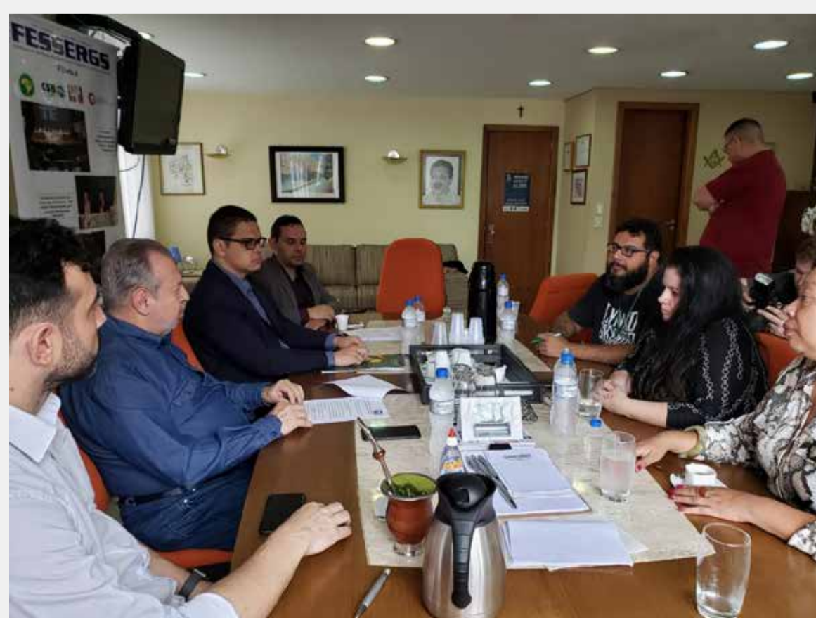
Entrevista para o jornal Correio do Povo na Fessergs, dia 05-11