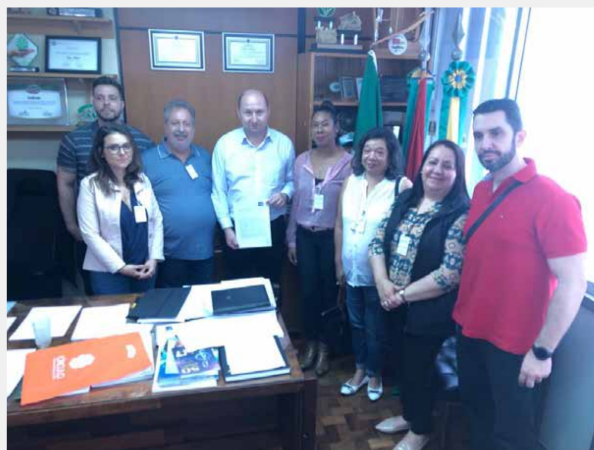
Visita aos líderes de bancada na ALERGS, dia 06-11