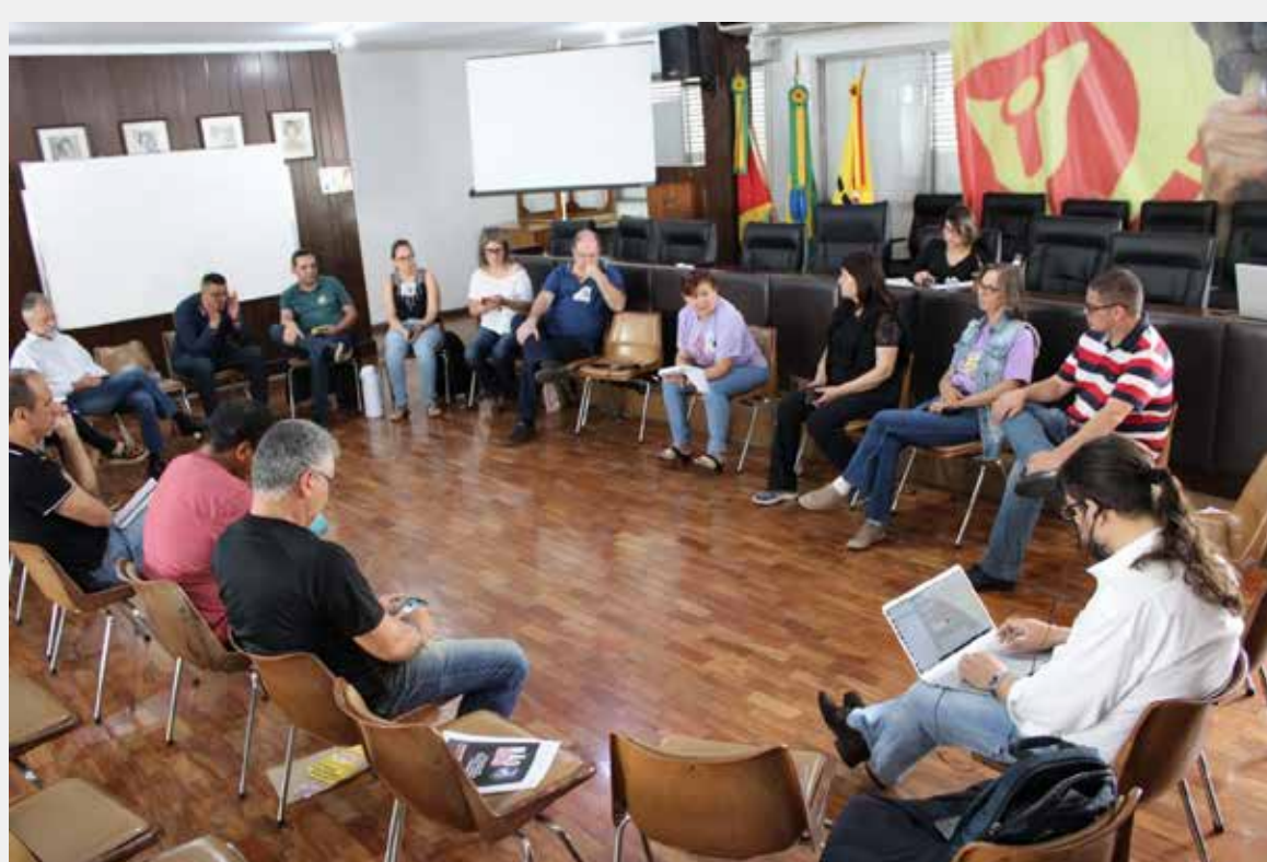
Reunião da FSP-RS no CPERS, dia 11-11