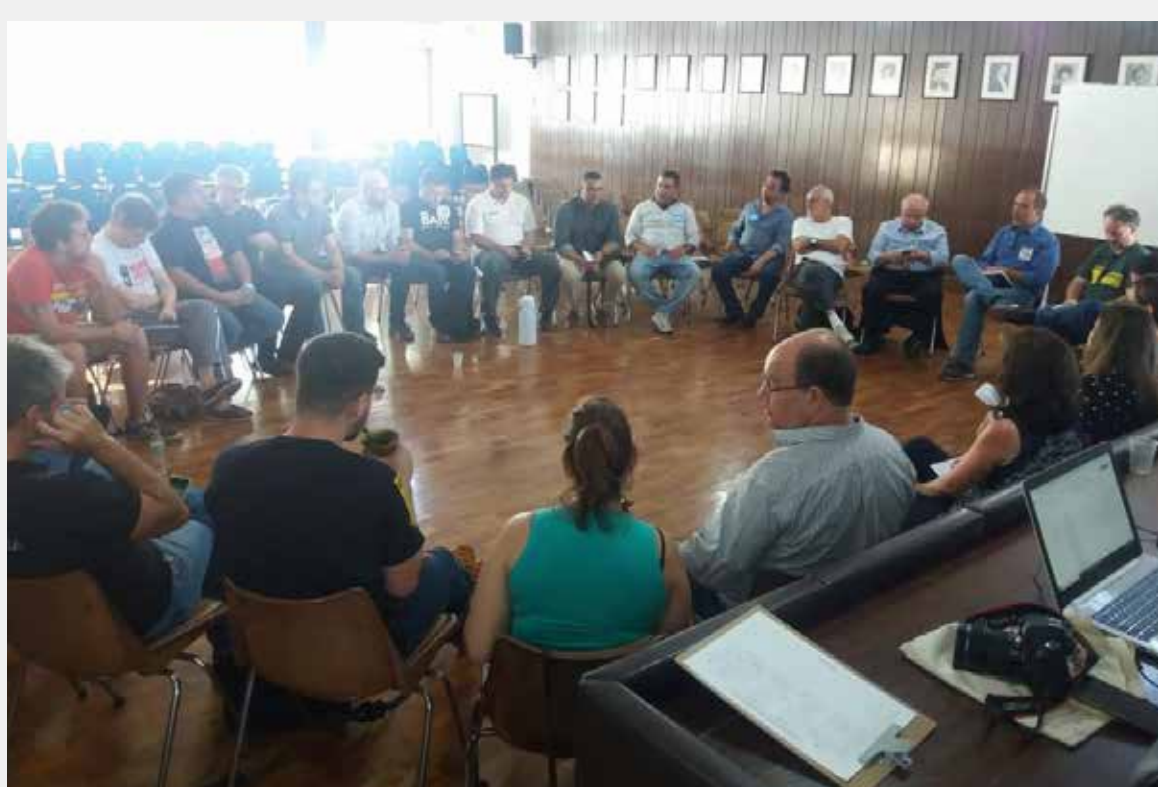
Reunião da FSP-RS no CPERS, dia 28-11