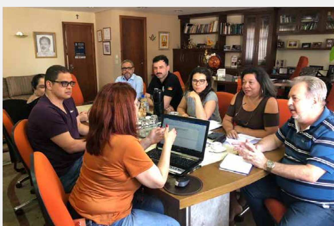
Reunião técnica do MUS na Fessergs, dia 18-11