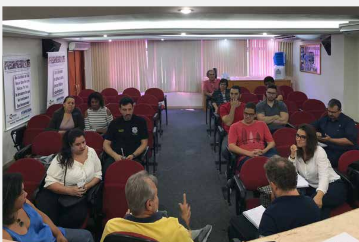
Reunião do MUS na FESSERGS, dia 25-11