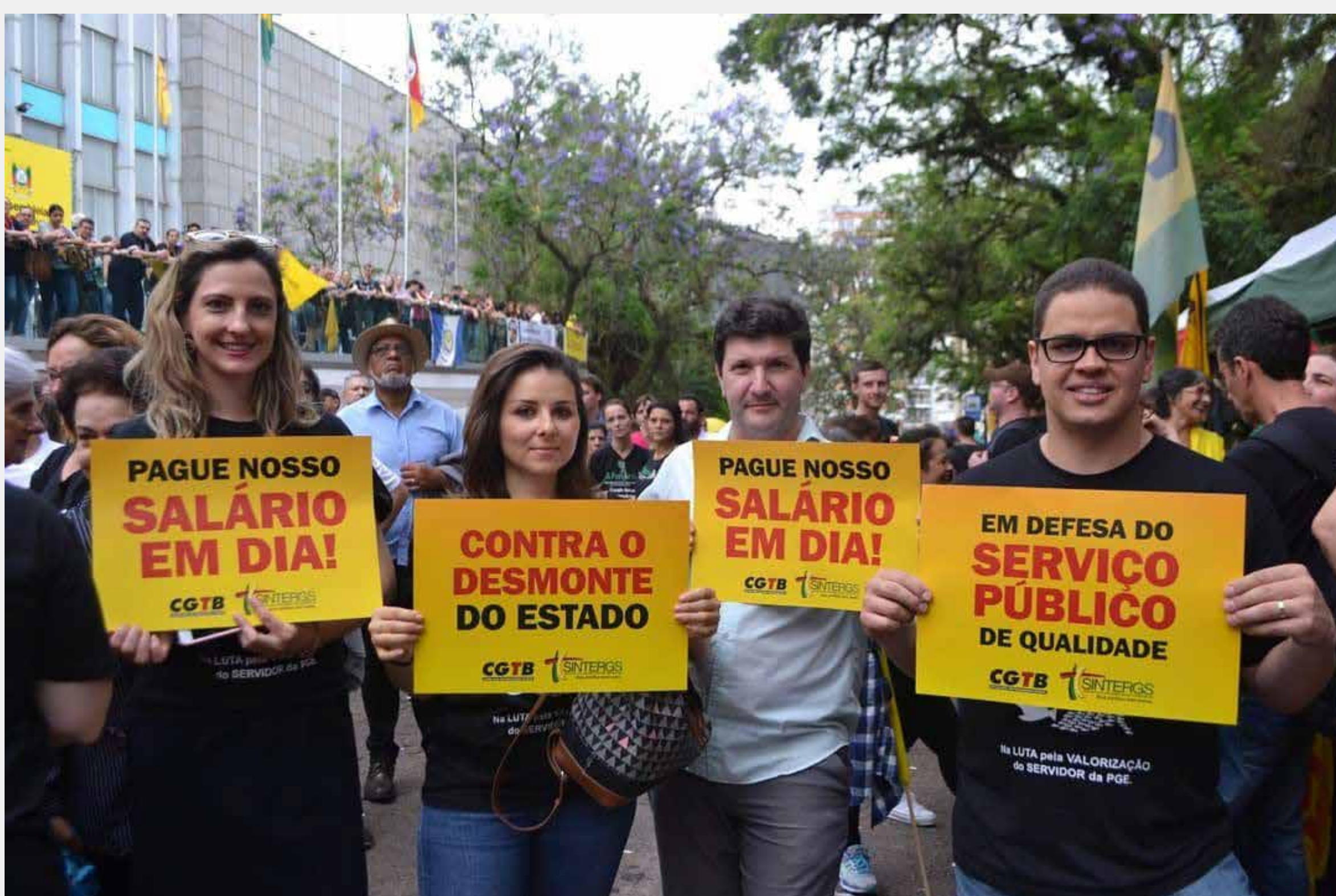
Ato Público na Praça da Matriz, dia 26-11

No dia 26 de novembro o SINDISPGE participou de Ato Público Unificado do Funcionalismo Municipal, Estadual e Federal, realizado após a Assembleia Geral do CPERS, na Praça da Matriz. Este ato foi mais uma demonstração de contrariedade ao pacote do Governo. Um novo ato está sendo preparado para o dia 10/12, quando a categoria será convocada.