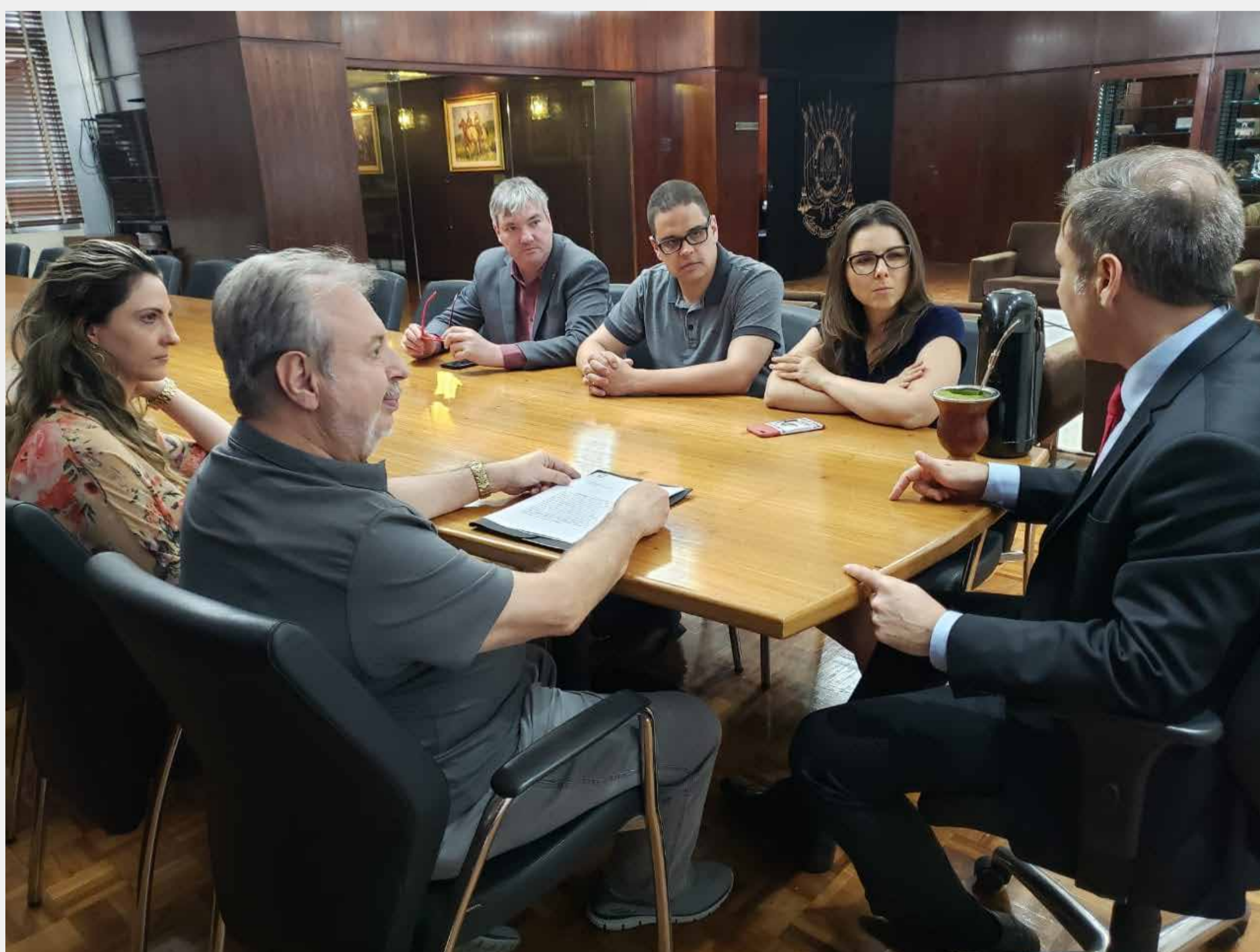
Reunião com o Presidente da ALERGS, dia 13-11

Antes do protocolo dos projetos, o SINDISPGE, em conjunto com as demais entidades do MUS, realizou visitas ao presidente da ALERGS, Luís Augusto Lara (PTB); ao líder do governo na Casa, Frederico Antunes (PP); e aos líderes de onze bancadas do parlamento gaúcho. Em todas as visitas, os deputados receberam um documento do MUS contrapondo as propostas do Governo.