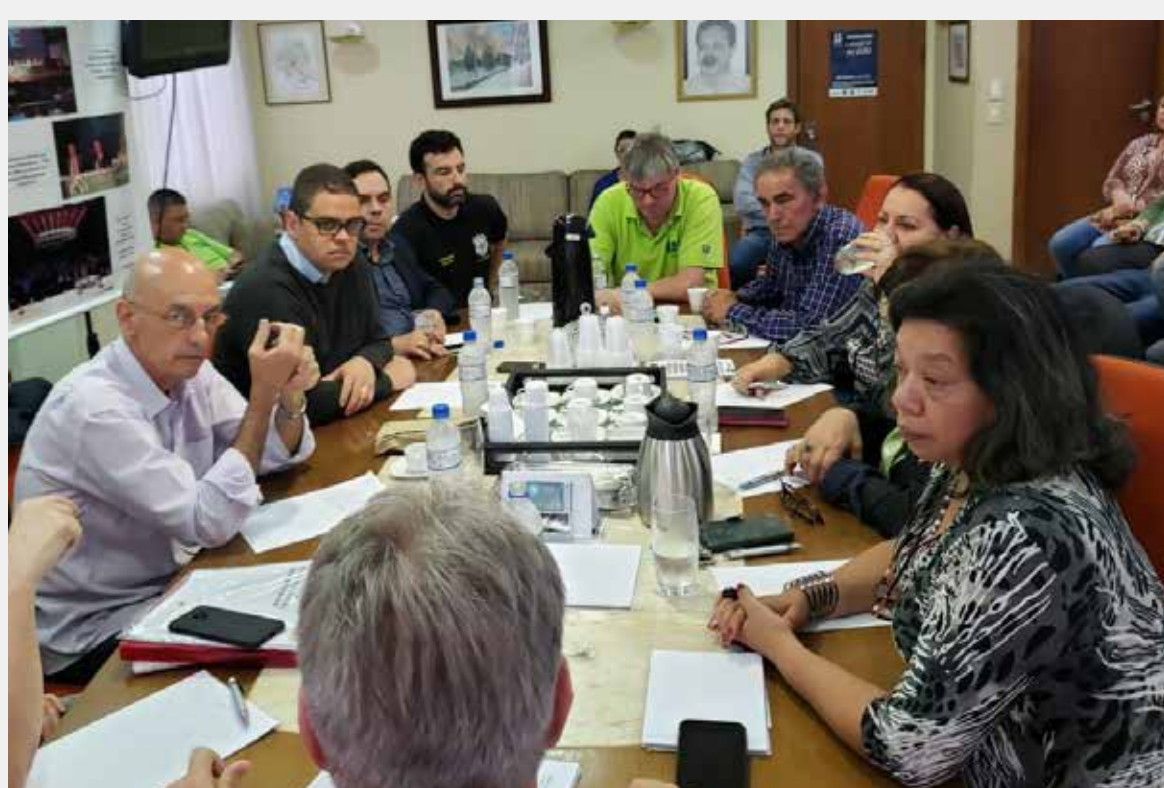
Reunião do MUS na FESSERGS, dia 04-11

O SINDISPGE é uma das poucas entidades classistas que tem participado, concomitantemente, tanto do MUS (Movimento Unificado dos Servidores), quanto da FSP/RS (Frente dos Servidores Públicos do RS), os dois principais grupos de entidades que têm combatido o pacote. Estes movimentos realizaram diversas reuniões de avaliação e organização da luta, neste último mês: