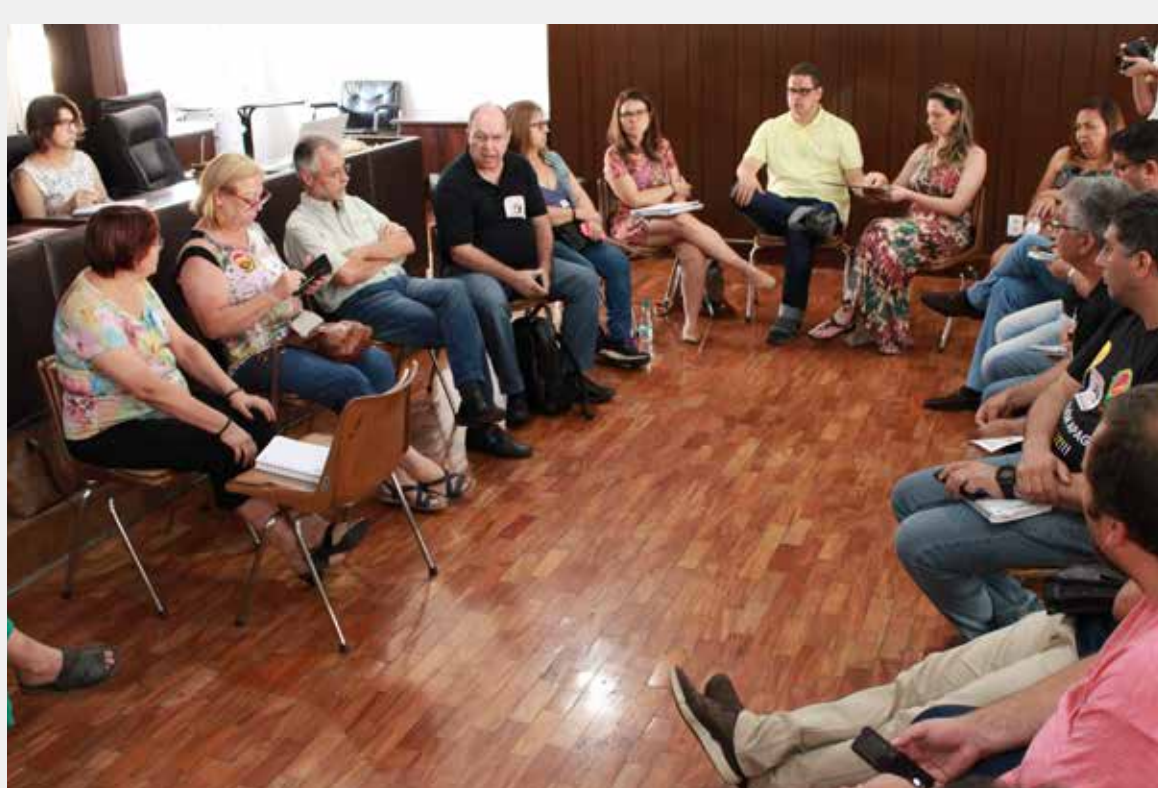
Reunião da FSP-RS no CPERS, dia 21-11